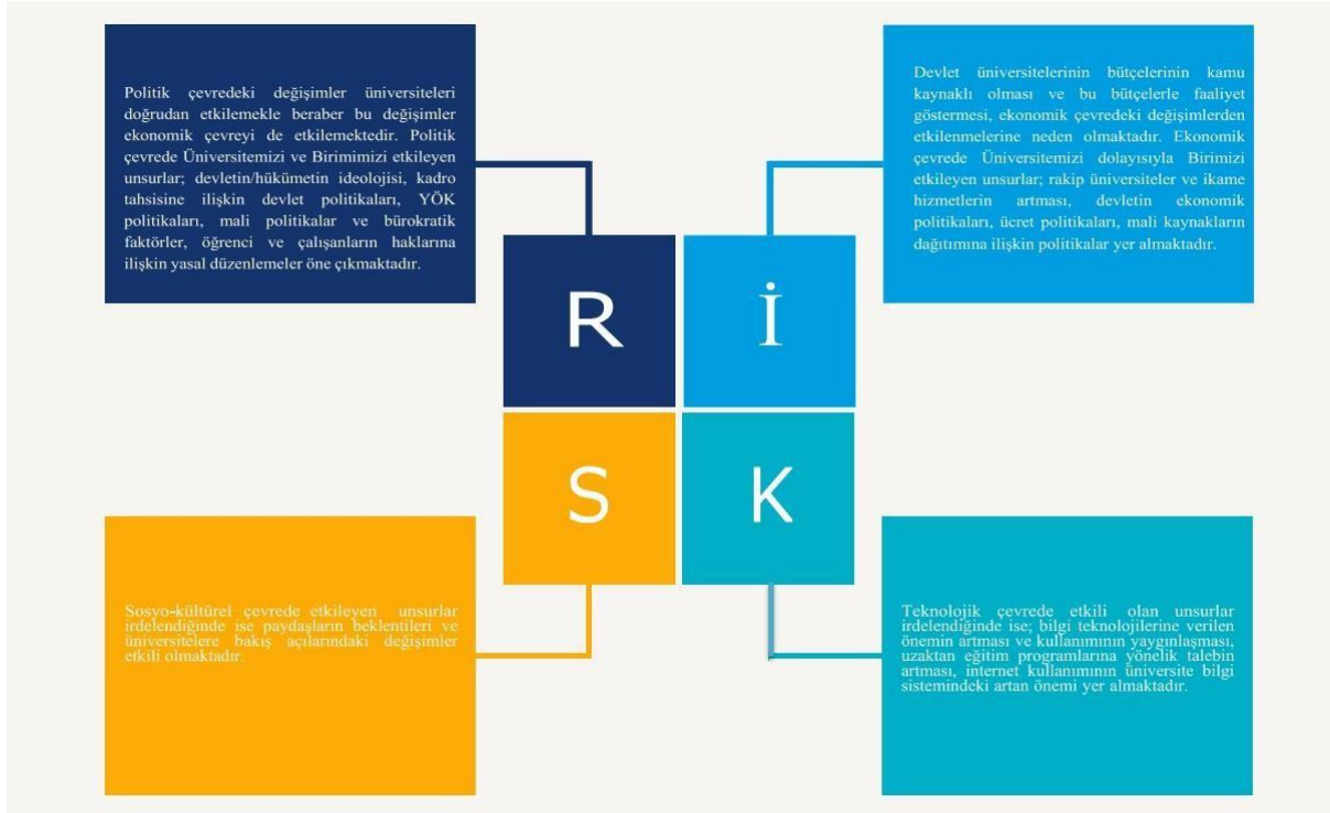
Görsel 3.1: Birim Risk Analizi