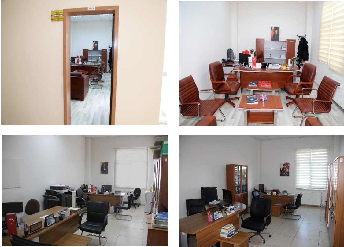
Görsel 1.2: Birime Ait Fotoğraflar