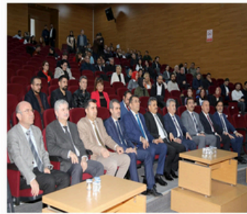
Üniversitemizde Kurumsal Akreditasyon Bilgilendirme Konferansı Düzenlendi