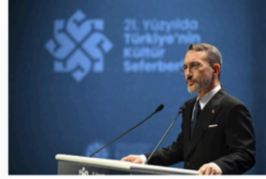
"21. Yüzyılda Türkiye'nin Kültür Seferberliği Sempozyumu"