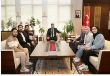
Üniversitemiz İyilik Haritası Toplantılarından Büyük Başarı