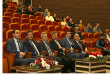
Üniversitemizde Kalite Toplantısı Gerçekleştirildi